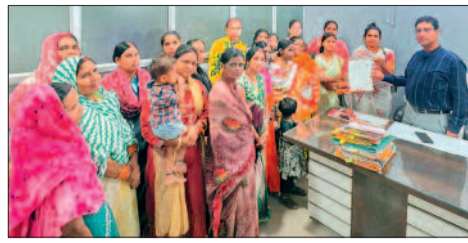
दोपहर के बजाय सुबह 8 बजे से पहले या शाम 5 बजे के बाद भेजे जाएं, क्योंकि दोपहर में अधिकांश लोग काम पर निकल

मोहल्लों में पानी की समस्या लगातार बनी हुई है। कई जगह नल कनेक्शन की पाइपलाइन ऊंचाई पर होने के कारण घरों तक पानी नहीं पहुंच पाता, जिससे लोगों को मजबूरी में पंप लगाकर पानी खींचना पड़ता है। इससे कई घरों तक पानी पहुंच ही नहीं पाता। उन्होंने बताया कि गर्मी के दौरान नहरों में पानी बंद होने के बाद भू-जल स्तर काफी नीचे चला जाता है, जिससे क्षेत्र के कई हैंडपंप सूख जाते हैं। ऐसे में लोगों को नगर निगम के टैंकरों के भरोसे रहना पड़ता है। उन्होंने मांग की कि पानी के टैंकर