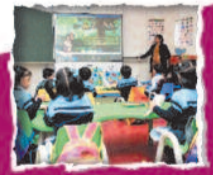
AC SMART CLASSROOMS